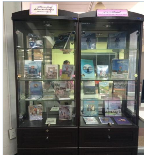
พื้นที่บริเวณตู้โชว์หนังสือพระราชนิพนธ์สมเด็จพระเทพรัตนราชสุดาฯ