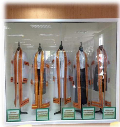
พื้นที่บริเวณห้องจดหมายเหตุ