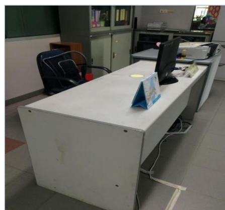
พื้นที่บริเวณโต๊ะทำงาน