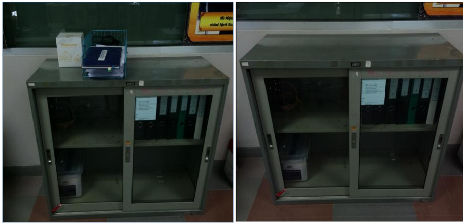
พื้นที่ดำเนินกิจกรรมบริเวณตู้เก็บเอกสาร